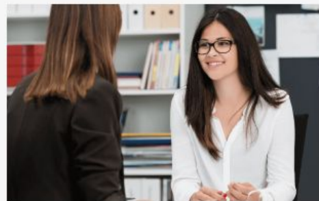
就活支援サービス