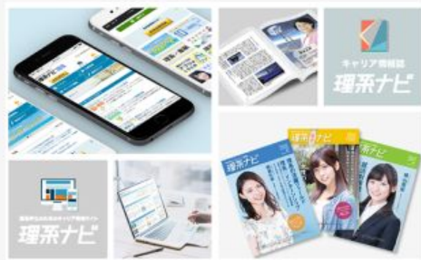
キャリア情報誌 「理系ナビ」

キャリアコンサルティング事業部では、 「理系学生」に特化したキャリア支援 および、 理系学生の採用を検討している法人向けの採用支援を行っています。