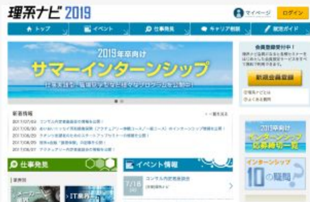
キャリア情報サイト 「理系ナビ」